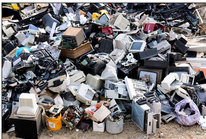
Figura 2 – Lixo eletrônico descartado incorretamente em aterro sanitário

O avanço da TI contribui de forma expressiva no descarte dos resíduos. Considera-se lixo eletrônico (ou ewaste ) os resíduos existentes em materiais e equipamentos eletrônicos que se tornam obsoletos, como computadores, celulares, tablets , televisores e outros eletroeletrônicos (MALTA, 2019). De acordo com o autor Maciel (2011), quando não há um descarte correto ou um processo de reciclagem adequado, esses equipamentos tornam-se lixo contaminado nos aterros sanitários e liberam substâncias tóxicas altamente prejudiciais à saúde e aos lençóis freáticos. A Figura 2 mostra um exemplo de descarte incorreto do lixo eletrônico.